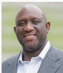
ウスビ・サコ 京都精華大学 学長