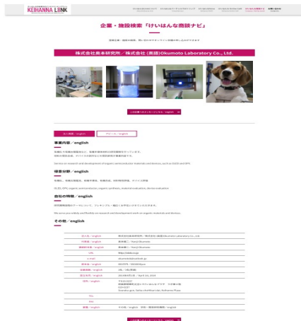
けいはんな商談ナビ