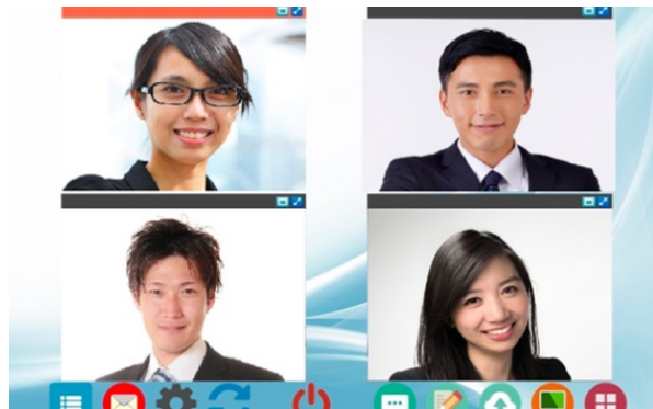
けいはんな Online Cafe